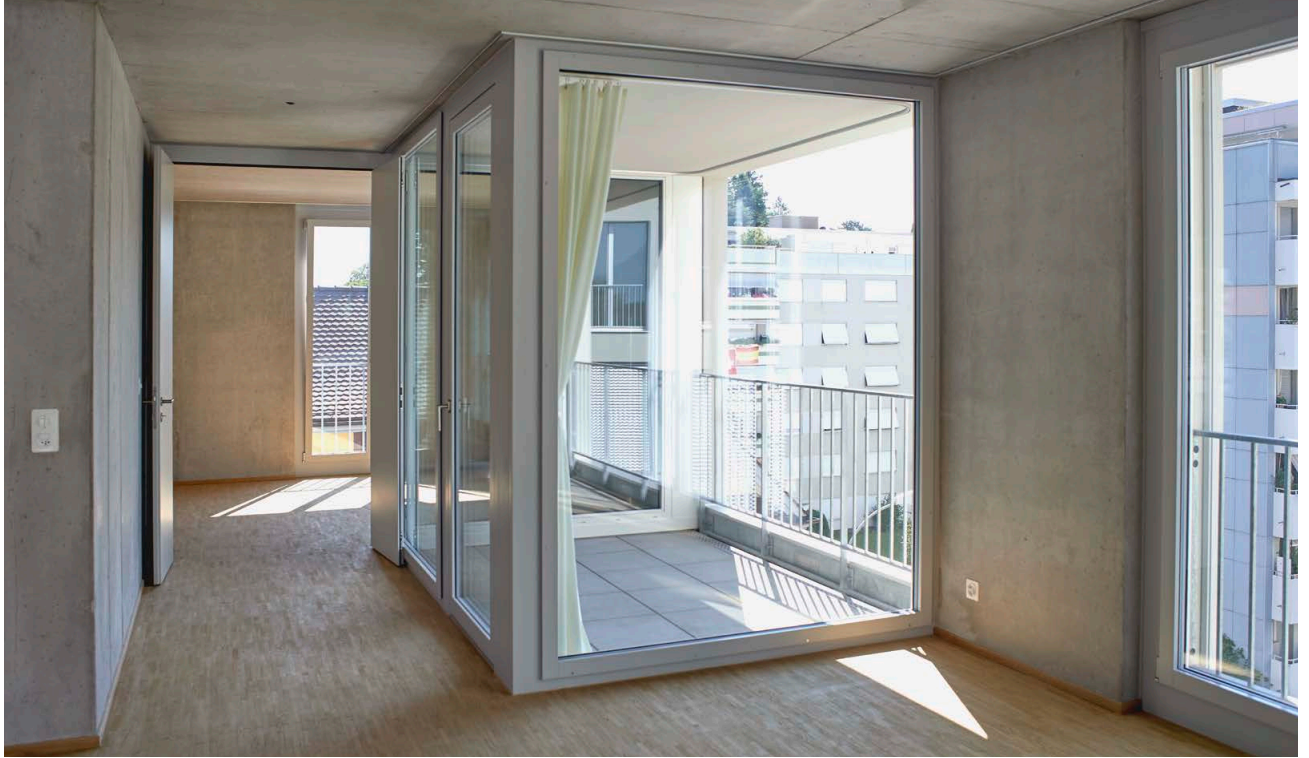
Loggia einer Wohnung in der Schachenstrasse 15B zur Illustration des Innenausbaus.