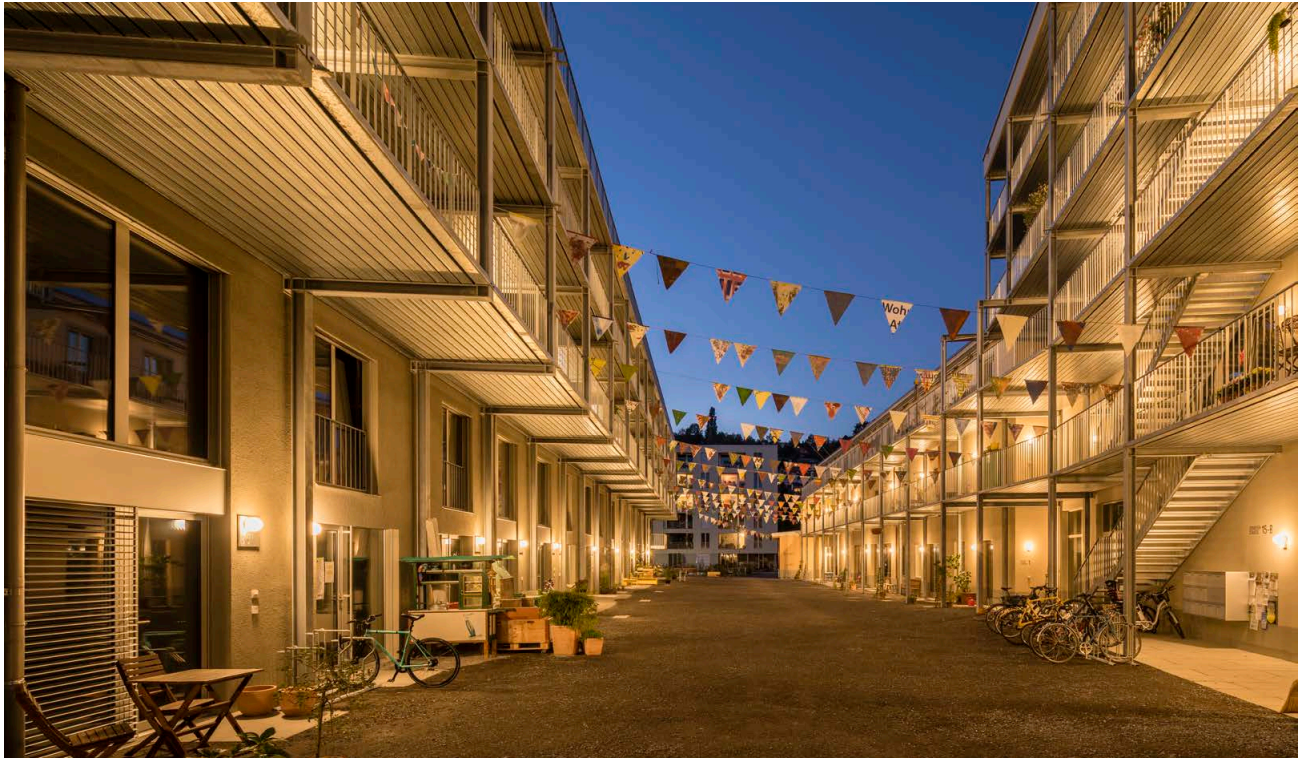
Innenhof der Siedlung.