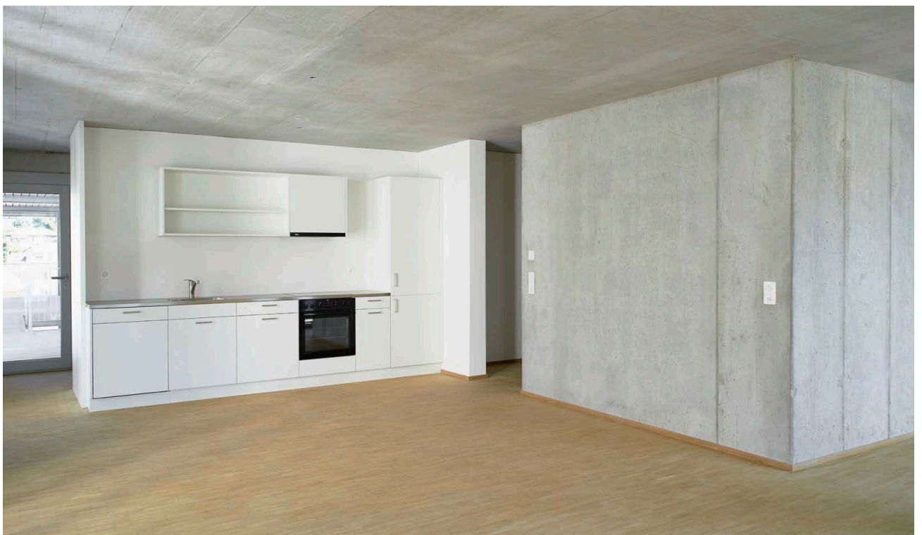
Wohn- und Kochbereich in einer Wohnung an der Schachenstrasse 15B zur Illustration des Innenausbaus.